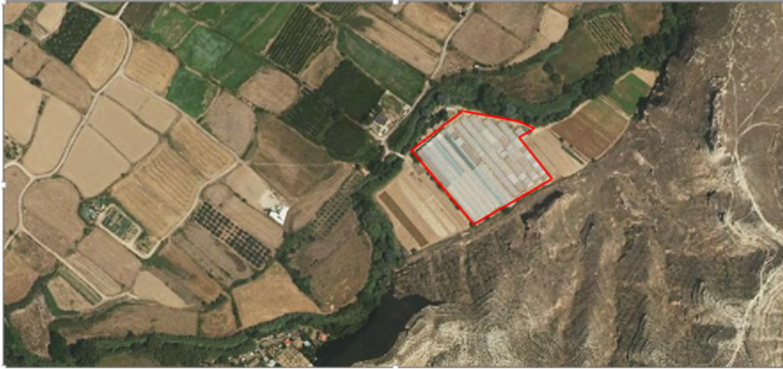
Ortofoto 1 – Ubicación de los invernaderos

Tras consultar el visor del Sistema Nacional de Cartografía de Zonas Inundables y las ortofotos históricas concluye que los invernaderos se instalaron con anterioridad al año 2016 y que se encuentran en zona de policía y en zona de flujo preferente. Asimismo, tras consultar al ayuntamiento correspondiente comprueba que la instalación cuenta con licencia municipal pero no con autorización del Organismo de cuenca.