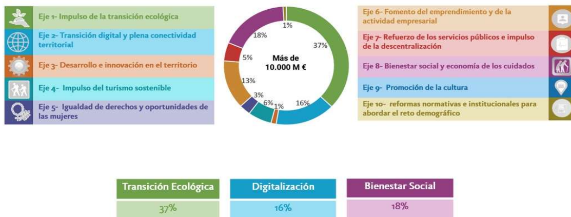
Ilustración 2. Inversión del plan 130 Medidas frente al Reto Demográfico, por ejes

Suponen una inversión estimada para el periodo 2021-2023 de más de 10.000 millones de euros, el mayor esfuerzo realizado nunca para abordar la igualdad de derechos y oportunidades en nuestros pequeños municipios.