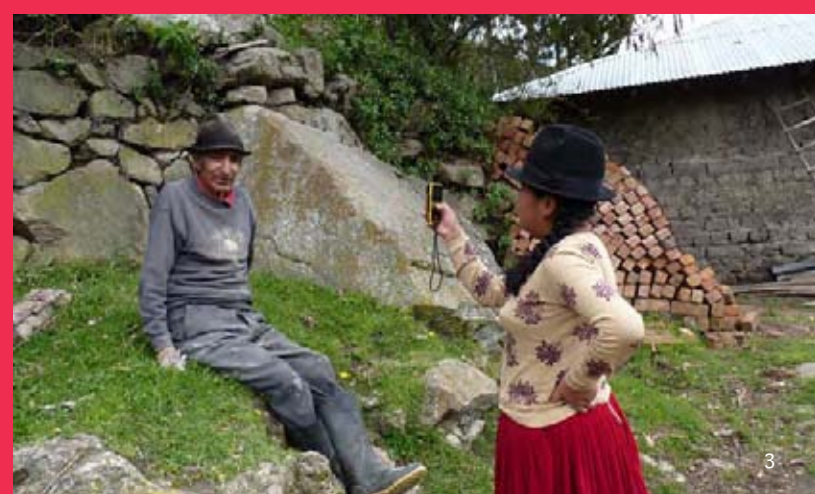
1. Reunión de representantes de la comunidad de Canrey, Parque Nacional Huacarán. 2. Facilitadores externos con un grupo de señoras de la comunidad de Tanta, Reserva Paisajística Nor Yauyos-Cochas. 3. Coinvestigadores entrevistando en Cochapampa, Parque Nacional Sangay.