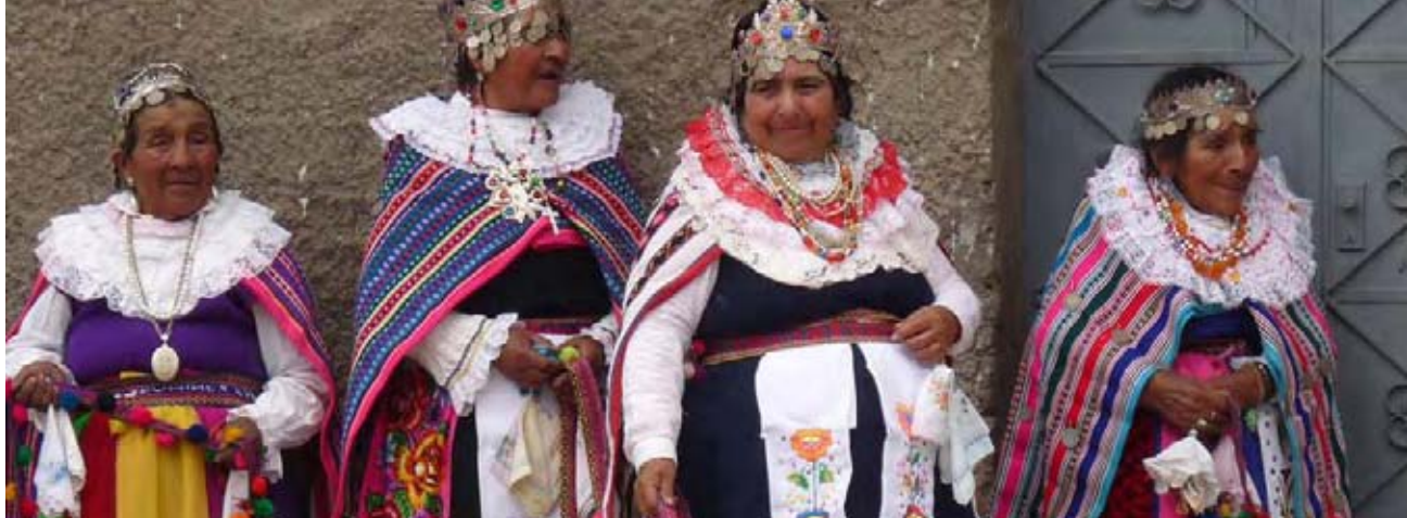
Celebración en la comunidad de Tanta, personificación de Los Ingas. Reserva Paisajística Nor Yauyos-Cochas.