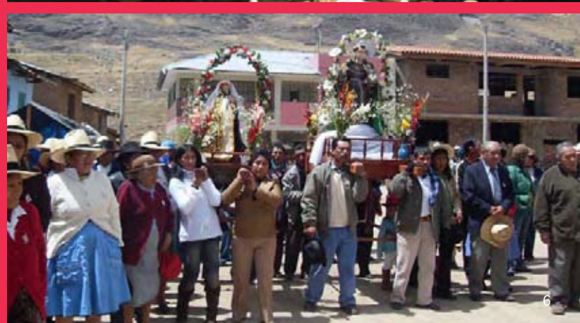
1. Danza. Reserva de Biosfera Huascarán. 2. Conocimientos sobre el uso de plantas medicinales. Lagunas Huarín. 3. Uso del telar a pedal. Reserva Paisajística Nor Yauyos-Cochas. 4. Festividad de la Virgen del Carmen en Mapaguiña. Parque Nacional Sangay. 5. Trueque de semillas. Comunidad Campesina de Vicos. 6. Procesión religiosa. Comunidad de Tanta.