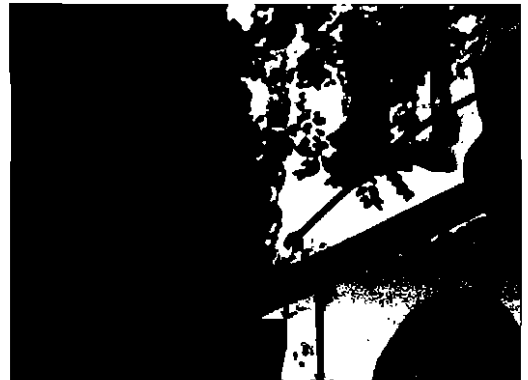
Fotos 1 y 2. Dispositivo utilizado para la inoculación de V. dahliae WCS850, y detalle del dosificador para la perfecta regulación del volumen administrado en cada incisión.