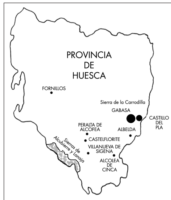
Figura 2 - Distribución geográfica de la sabina albar ( Juniperus thurifera L.) en la provincia de Huesca. El área punteada corresponde a una presencia más continua en las sierras del sur de la provincia, mientras los círculos significan una presencia puntual. Se han destacado los puntos correspondientes a Gabasa (localidades aportadas en este artículo) y Castelló del Plá (RODRÍGUEZ OCHOA & PEDROL 1999: 66).

En la provincia de Huesca (figura 2), la sabina albar vive en los Monegros (salpica los montes de Alcubierre, Pallaruelo, Lanaja, Castejón de Monegros, Valfarta y Villanueva de Sigena); algo más al N se da en Castelflorite, Alcolea de Cinca y Peralta de Alcofea (FERRÁNDEZ 1997: 277-278), ya en forma de algún rodal o individuos aislados. En estos puntos periféricos de su área en la parte septentrional de la Depresión del Ebro, como ocurre en otros puntos de España, los mapas reflejan en varias ocasiones