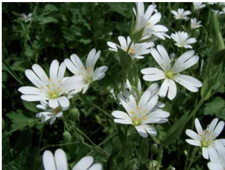
e) Stellaria holostea , propia del ambiente de hayedos.