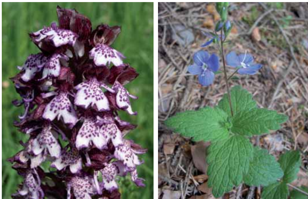
c) Orchis purpurea , pastizales seminaturales, una de las numerosas y más bellas orquídeas silvestres de la Finca.