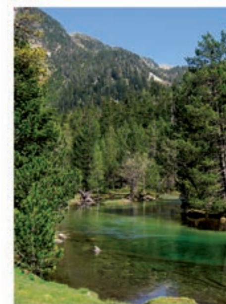
L'aigua està present en molts racons del Parc.

DADES ■ superfície de terra ■ superfície d'aigua