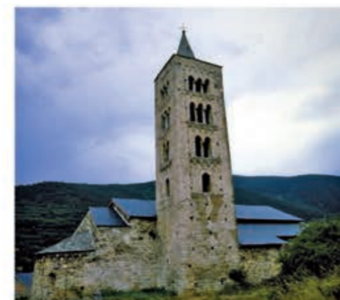
Església de Sant Just i Sant Pastor de Son.