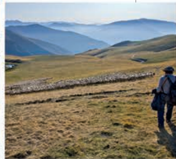
Paisatge ramader a les muntanyes de Llessui