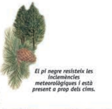
El pi negre resisteix les inclemències meteorològiques i està present a prop dels cims.