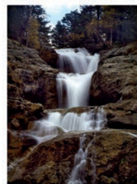
Cascada de Sant Esperit.