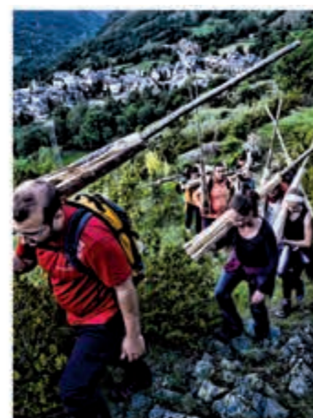
Celebració de la festa de les Falles a Boi.