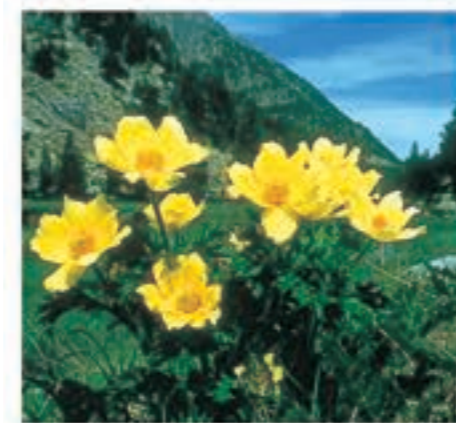
L'esplendor de les flors d'alta muntanya embelleix el paisatge.