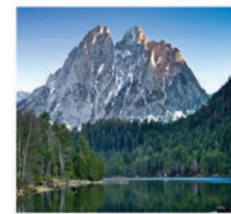
Els pics dels Encantats constitueixen un referent del Parc.