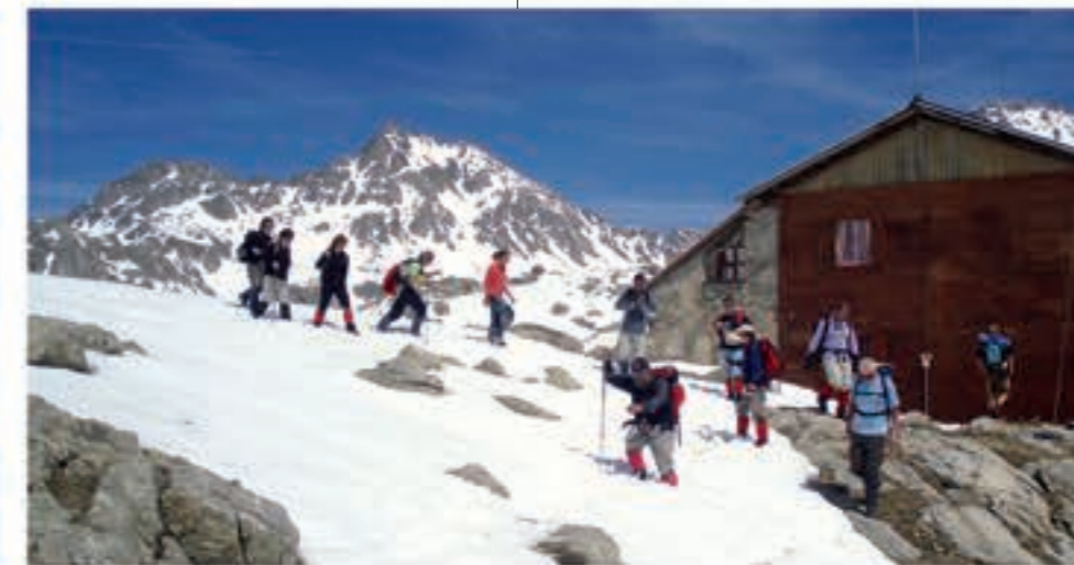
Refugi de la Colomina