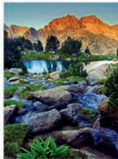
Estany de la Llosa