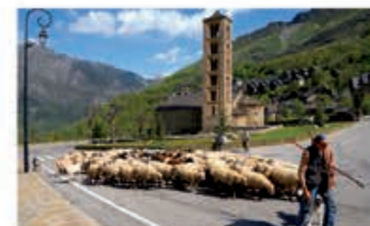
Església de Sant Climent de Taüll, patrimoni de la Humanitat.

Aspectes culturals. El Parc Nacional està situat en una zona que compta amb un gran patrimoni històric. Els pobles dels Pirineus sempre han estat determinats per les característiques geogràfiques: l'orografia extrema ha dificultat les comunicacions, i el clima rigorós ha provocat l'establiment de nuclis humans reduïts i propers entre si. El Parc ja era utilitzat per grups de ramaders nòmades com a zona de pastura d'estiu durant el període neolític (fa uns 9.000 anys). Els primers assentaments permanents d'aquestes valls devien ser obra d'antics pobladors que parlarien un antic idioma preromànic, l'iberobasc, que encara es conserva avui en l'arrel del nom de molts pobles. La romanització va deixar algunes clares evidències a la val d'Aran. A partir de la instauració de la Marca Hispànica, a finals del segle VIII, i la formació dels comtats pirinencs a finals del IX, sorgeix un fort corrent polític i religiós que dona els elements culturals del romànic: esglésies amb escultures i pintures murals, esvelts campanars, monestirs, castells, torres de guaita i ponts constitueixen un patrimoni artístic únic perfectament integrat al paisatge que l'envolta.