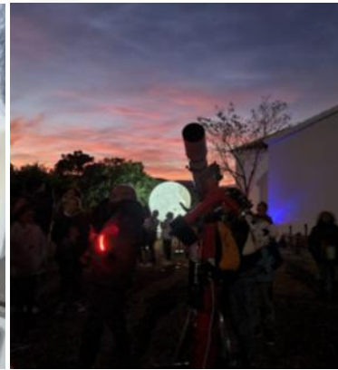
Actividades del 27 aniversario del PNC