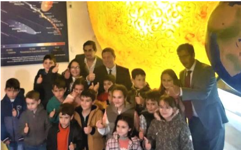
Inauguración del centro astronómico, Alcoba de los Montes