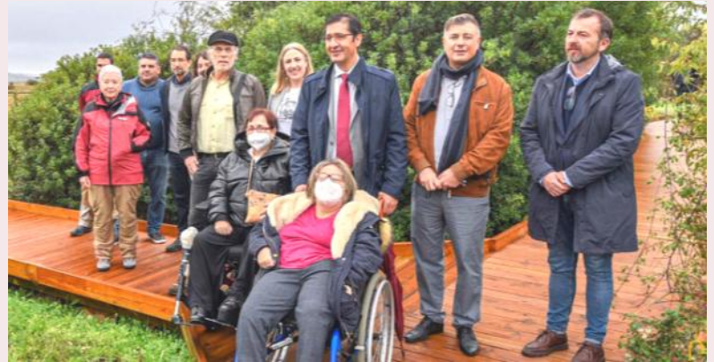
Inauguración de las pasarelas de Casa Palillos

Las obras de remodelación se realizaron en la senda botánica, un sencillo itinerario que permite conocer la flora más característica de Cabañeros entorno al centro de visitantes. El paso del tiempo ha ido deteriorando las pasarelas originales, lo que dificultaba el acceso a personas con movilidad reducida, que hoy pueden disfrutar sin ningún tipo de barrera de este bonito recorrido.