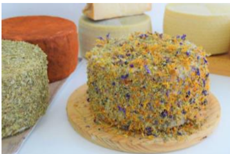
Queso Primavera / Cerrucos de Kanama

El certamen más prestigioso de productores de queso "World Cheese Awards", celebrado el pasado 2 de noviembre en Newport, Gales (Reino Unido), ha reconocido el saber hacer de las queserías de la zona, premiando a 3 de ellas: Adiano, con 9 galardones en su primer año de existencia, 1 bronce para Valdehornos y su exquisito queso curado en aceite y otro bronce para el colorido y aromático queso Primavera de Cerrucos de Kanama. ¡Enhorabuena!