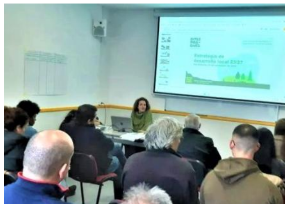
Mesa comarcal de Entreparkes

La Asociación de Desarrollo Entreparkes celebró, el pasado 23 de noviembre en Santa Quiteria, un encuentro para informar del grado de ejecución de la actual Estrategia de Desarrollo Local Participativo y comenzar a elaborar la nueva. La despoblación, el tejido social asociativo, la igualdad, las pymes, el turismo y el cambio climático, fueron algunos de los temas que los asistentes propusieron abordar en el nuevo periodo.