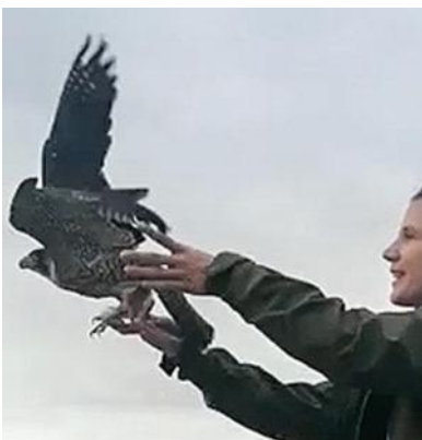
Suelta de Halcón peregrino /