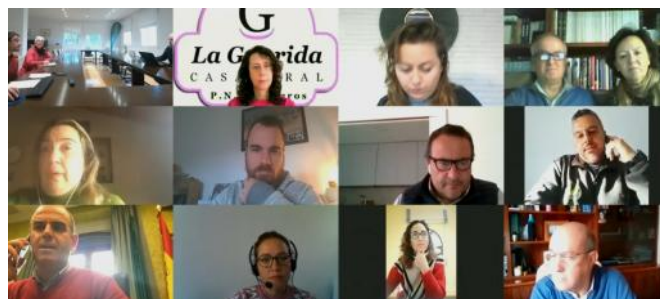
Reunión online del Foro de la CETS

A continuación estaba prevista la reunión anual del Foro de turismo sostenible, que tuvo que realizarse de manera virtual por estas mismas razones. En el encuentro se valoraron los avances logrados a lo largo de 2022. Algunos de los más destacables se han conseguido en los ámbitos de la promoción, las actividades dirigidas a la población local, a los escolares y a los visitantes y la mejora del uso público, gracias al esfuerzo de las administraciones y de las partes involucradas, a los programas de sostenibilidad turística que gestionan las diputaciones de Ciudad Real y Toledo y a las ayudas, que están facilitando el cumplimiento de los compromisos.