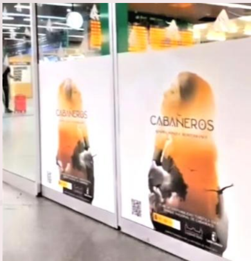
Carteles promocionales en la estación de Atocha (Madrid)

La celebración del aniversario llegó hasta Madrid, con una campaña promocional en la estación de Atocha en la que se instalaron carteles invitando a sus usuarios a respirar el bosque mediterráneo en Cabañeros, tan cercano a la capital.