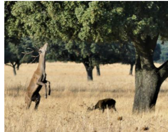
Ciervo consiguiendo bellotas

incluye organismos tan diferentes como árboles, ratones, ungulados y carnívoros, asegurará la regeneración y el funcionamiento a largo plazo del encinar.