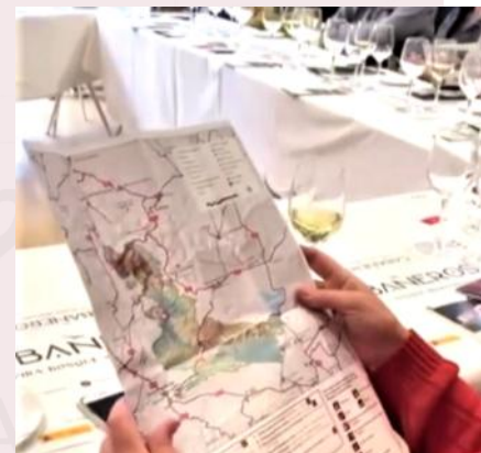
Cata de vino / O.T. CLM en Madrid

El broche final lo puso la cata de vino en la oficina de turismo de Castilla-La Mancha en Madrid, que organizó la Diputación de Ciudad Real, de la mano de la bodega "Dehesa del Carrizal" (Retuerta del Bullaque), junto con un surtido de ibéricos y quesos locales para deleite de los asistentes.