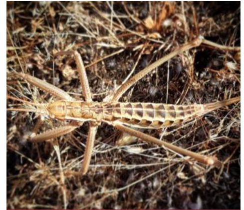
Saga Pedo , uno de los ortópteros más grandes de Europa y con poblaciones escasas, dispersas y poco numerosas, se ha visto en Cabañeros el pasado 20 de julio

Sus principales amenazas son la fragmentación de su reducido hábitat (desaparición de zonas de matorral por el pastoreo intensivo) así como la utilización de insecticidas que les afectan, tanto directamente como a sus principales fuentes de alimento, dos aspectos de los que está a salvo en el Parque Nacional de Cabañeros.