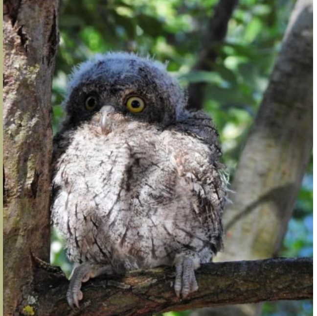
Pollo de Autillo europeo .

Curso: Ecoturismo en los Espacios Naturales Protegidos de la provincia de Ciudad Real