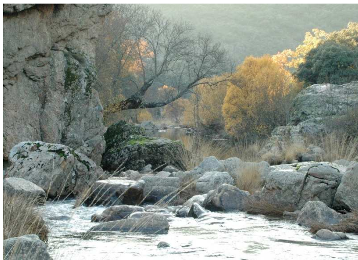
Ruta del Boquerón del Estena.