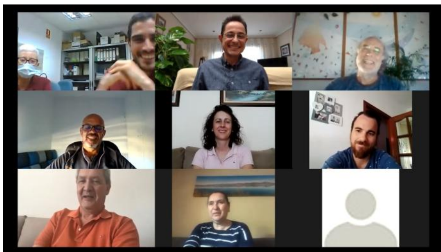
Reunión con los empresarios adheridos a la CETS

➤ Prosiguen los trabajos de la Carta Europea de Turismo Sostenible, tras el “shock” inicial que provocó la pandemia en el sector turístico del territorio, que ahora permanece más unido para superar el bache.