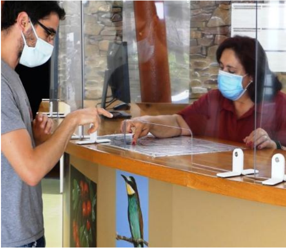
Centro de visitantes de Horcajo de los Montes

A mediados de junio, tras el obligado cierre de tres meses, los visitantes han vuelto a disfrutar de las instalaciones de uso público del Parque Nacional de Cabañeros.