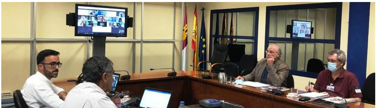
Miembros del Patronato durante la reunión.

Tras la contestación de las alegaciones realizadas al borrador del Plan Rector de Uso y Gestión del Parque Nacional de Cabañeros, el Patronato se reunió el día 30 de junio en la sede de la Consejería de Desarrollo Sostenible, en Toledo, que dio luz verde al documento, tras un largo proceso participativo. Posteriormente, el Plan deberá ser informado por el Consejo de la Red de Parques Nacionales, para a continuación ser aprobado finalmente por el Gobierno regional.