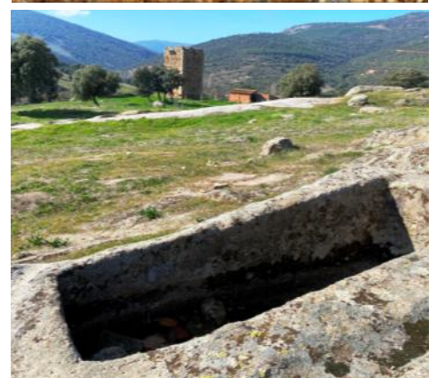
Arriba Sisón común ( Tetrax tetrax ); abajo yacimiento de Malamoneda