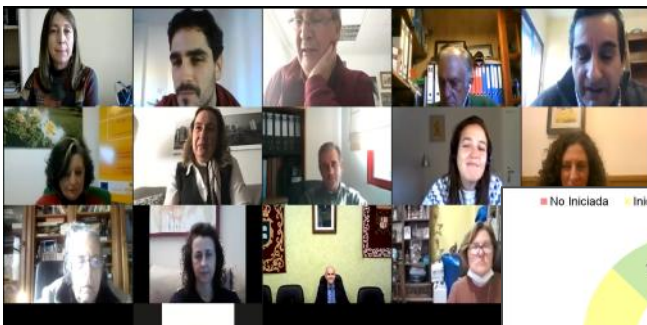
Reunión del Foro CETS el 17/12/2020

El seguimiento de las actuaciones previstas indica que el 26 % de las actuaciones aún no se han iniciado, frente a un 61% que ya se han puesto en marcha y un 13% que se encuentran en situación avanzada. Este balance resulta positivo teniendo en cuenta que es el primer año del Plan de Acción y las limitaciones derivadas de las restricciones a causa de la pandemia de COVID-19 que tanto han afectado al sector. No obstante, se hizo hincapié una vez más en la necesaria implicación de todos los actores involucrados.