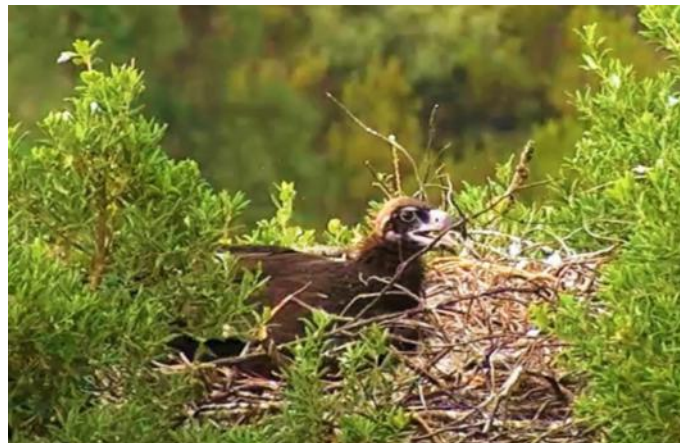
Pollo de Buitre negro ( Aegypius monachus )