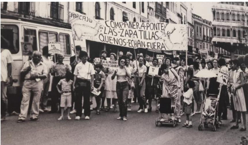
Movilización en la Plaza Mayor de Ciudad Real a favor de la protección de Cabañeros.

Compuesto por encinas, quejigos, alcornoques, rebollos y matorrales de jaras, brezos, romero y madroño, son los árboles y arbustos más representativos que coexisten con acebos, tejos y abedules, testigos de épocas más frías, que junto con las turberas o “trampales”, constituyen las mayores singularidades del espacio.