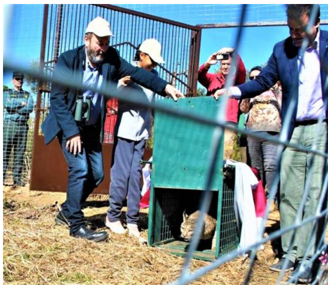
Suelta de Carla en el Parque Nacional de Cabañeros

Autónomo Parques Nacionales y la Consejería de Desarrollo Sostenible de la Junta de Comunidades de Castilla-La Mancha, entre otras entidades.