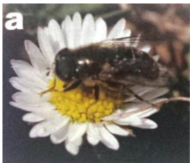
Merodon cabagnerensis , una de las especies de insectos encontrados por primera vez en Cabañeros, y polinizador de la cebolla almorrانera

Pero es que además, la cebolla almorrانera tiene una íntima relación con unos insectos dípteros del género Eumerus . Un equipo de investigadores del CIBIO de la Universidad de Alicante ha encontrado al estudiar la biodiversidad entomológica del Parque Nacional de Cabañeros (proyecto subvencionado por Parques Nacionales) tres especies nuevas para la ciencia, o sea tres especies de insectos que no se conocían, y las han bautizado como Merodon cabagnerensis , Merodon antonioi y Merodon luteihumerus .