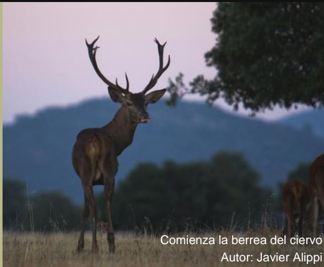
Comienza la berrea del ciervo

Charla y exposición del Proyecto LIFE+Iberlince