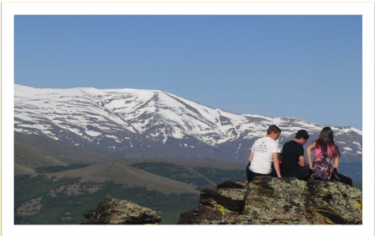
Cuerda de los Morrones (La Ragua)