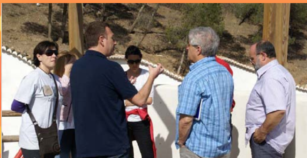
Visita del evaluador de la CETS