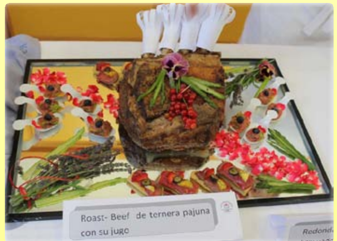
Roast- Beef de ternera pajuna con su juro

La finalidad es estudiar la producción de esta raza en extensivo (capacidad sustentadora, rendimiento) en la Finca de Cortes, (Bérchules) propiedad de la Junta de Andalucía y gestionada por la Consejería de Medio Ambiente y Ordenación del Territorio, así como evaluar las características de la canal, calidad de la carne y sus vías de comercialización.