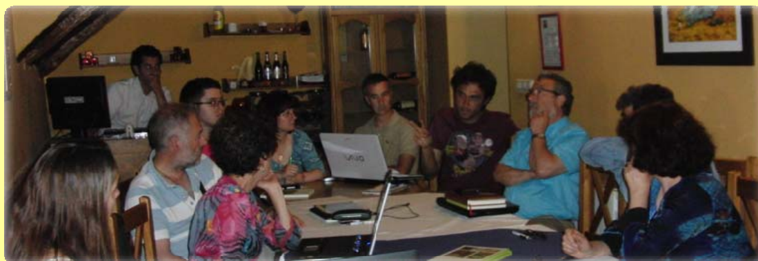
Empresarios durante la jornada formativa colectiva, el día 9 de junio