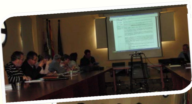
Miembros del Foro durante las reuniones de renovación de la CETS