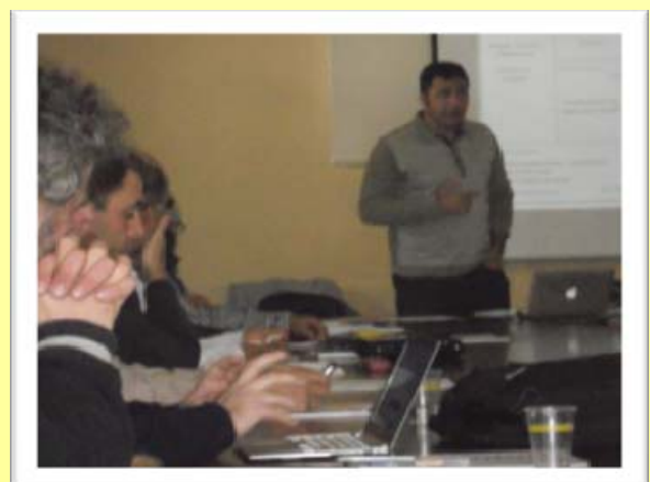
Momento durante el taller de mejora

El taller se enmarcó en el proyecto Turisnatura II, un proyecto de Andanatura en colaboración con la Fundación Biodiversidad (Programa Empleaverde), cofinanciado por el Programa Operativo (PO) Adaptabilidad y Empleo del Fondo Social Europeo (FSE).