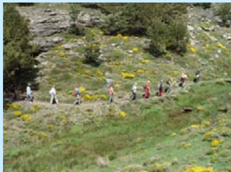
Salidas de campo durante las Jornadas

Los paneles de experiencias presentados (el Club de Producto por la Secretaría de Estado de Turismo, la Agrupación Empresarial Innovadora en torno a la CETS por la Fundación Andaluza de Formación y Empleo y, la experiencia del mayor consorcio turístico europeo TUI AG (Touristic Union Internacional)) versaron sobre proyectos de comercialización en torno a las empresas de turismo adheridas a la CETS y que ofrecen sus servicios en los espacios naturales protegidos que también se encuentran acreditados.