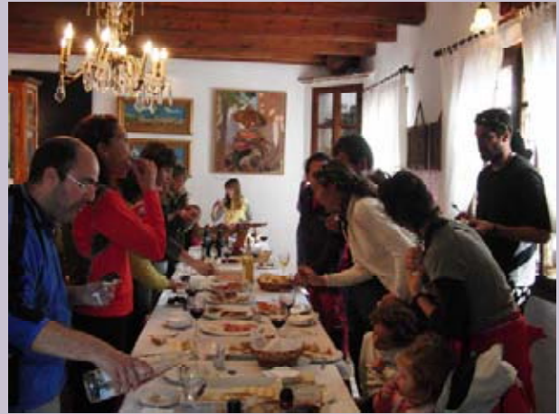
Degustación en la Alquería de Morayma