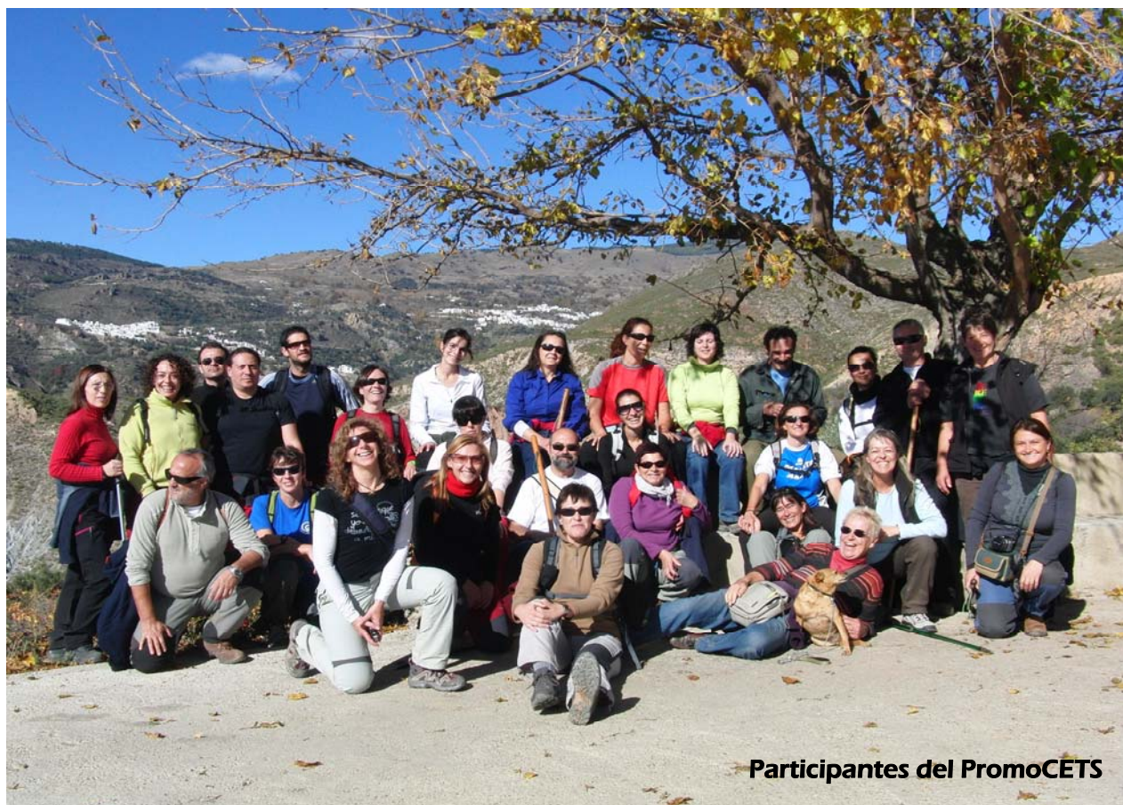
Participantes del PromoCETS