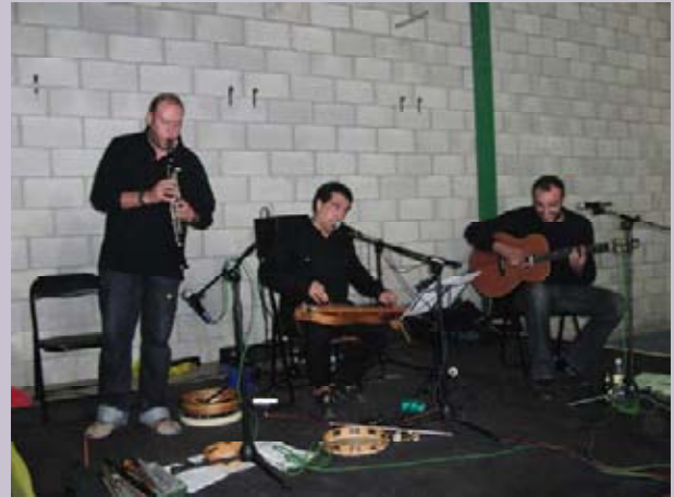
Momento del concierto de la Banda Monfi

Además, se invitó a los asistentes a que participaran en un concurso de fotografía, donde se premió la imagen más representativa y acorde con la esencia de las jornadas.