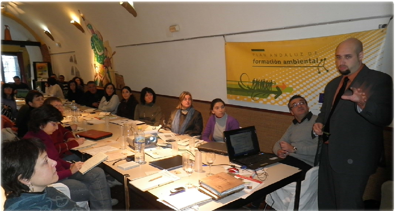
Participantes del curso

Del 15 al 17 de diciembre se celebró en Alcadia de Guadix, en el alojamiento turístico Cuevas del Tío Tobas, el curso de “Nuevas formas de comercialización turística en Espacios Protegidos”, a través del Plan Andaluz de Formación Ambiental, financiado por el Programa Operativo del Fondo Social Europeo 2007-13 de Andalucía.