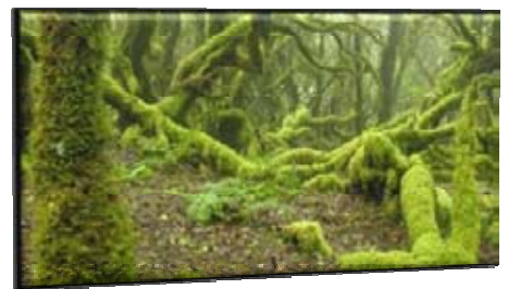
Parque Nacional Garajonay

La Carta Europea de Turismo Sostenible es ya una realidad, pero también tiene importantes lagunas que, a través de los Grupos de Acción Local, se pretenden solventar con este proyecto de cooperación.