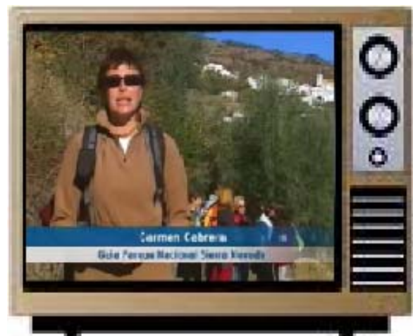
Programa Tierras Altas

Esta experiencia puede servir a su vez para el diseño de un producto ecoturístico específico, comprometido con la sostenibilidad de los negocios existentes en la zona y con la del Parque Nacional y Parque Natural de Sierra Nevada.