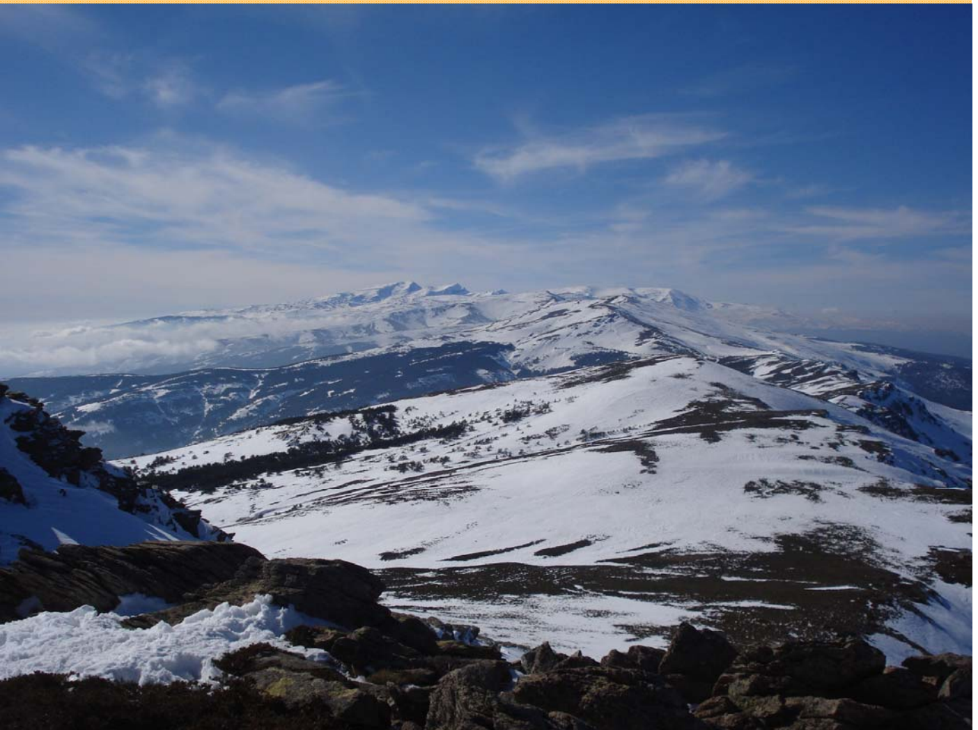
Paisaje desde el Cerro del Almirez