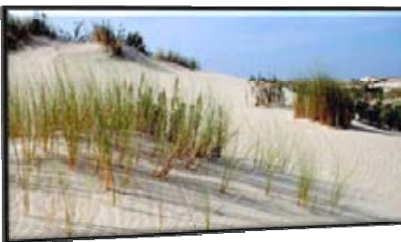
Parque Nacional Doñana