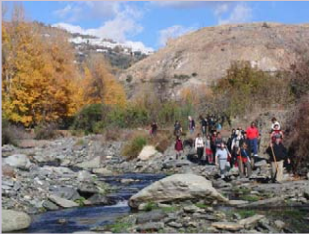
Itinerario de Bérchules a Cádiar