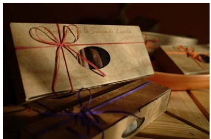
Chocolates de la Abuela Ily. Marca Parque Natural de Andalucía