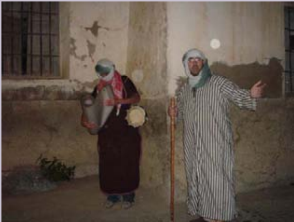
Personajes del itinerario interpretado