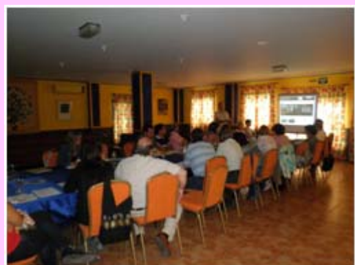
I Reunión de la Asociación. Mecina Fondales

Los principales resultados del I encuentro de la Asociación son: