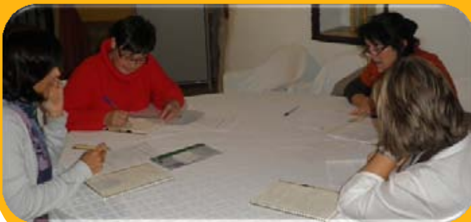
Alumnas durante las sesiones prácticas

Los alumnos han comprendido que estamos en una sociedad muy agresiva y cambiante en lo que incumbe al sector turístico y que es necesario saber desenvolverse en el mercado actual, sobre todo, en cómo hacerse más visible en internet y en cómo comunicar la empresa.