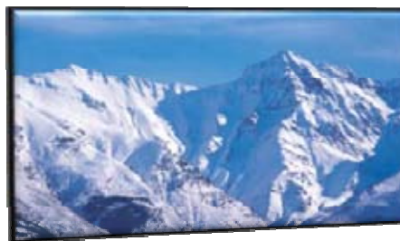
Parque Nacional Sierra Nevada