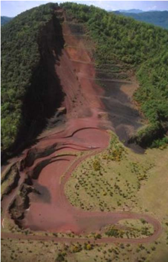
Parque Natural Zona Volcánica de la Garrotxa

La asociación se rige por cuatro órganos: La asamblea general, la junta de gobierno, el consejo de cooperación y el equipo gestor, formado por tres personas: dos técnicos y una gerente. Además, para los trabajos relacionados con la Carta europea funciona una comisión técnica permanente de coordinación que asegura el seguimiento del Plan de actuación de la Carta y que dirige también el proceso de renovación de la Carta.