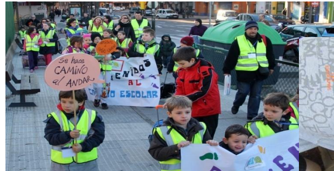
CEIP Jerónimo Zurita