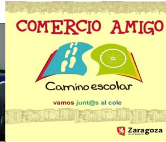
Caperucita camina sola