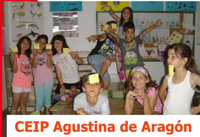
CEIP Agustina de Aragón