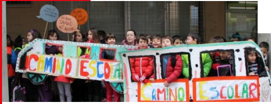
Jueves de Carnaval