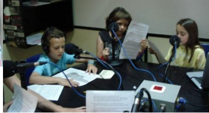
A la radio