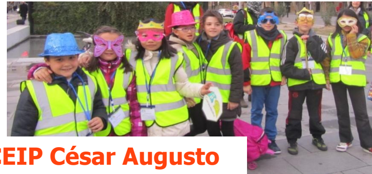
CEIP César Augusto