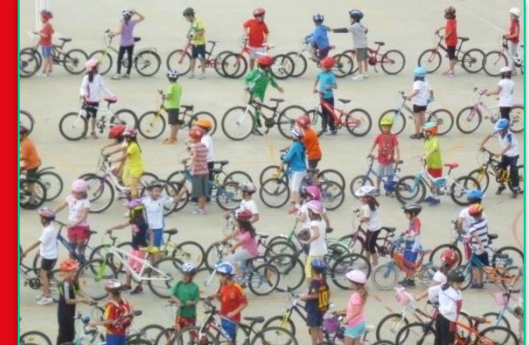
Bicicletada escolar y bicicletada por el barrio