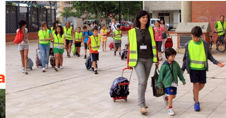
CEIP La Jota

Se pusieron en marcha 5 rutas diferentes en las que participaron unos 70 niños y niñas