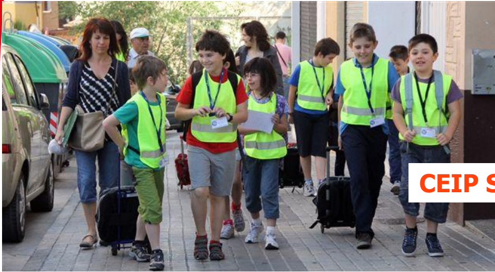
CEIP Sainz de Varanda