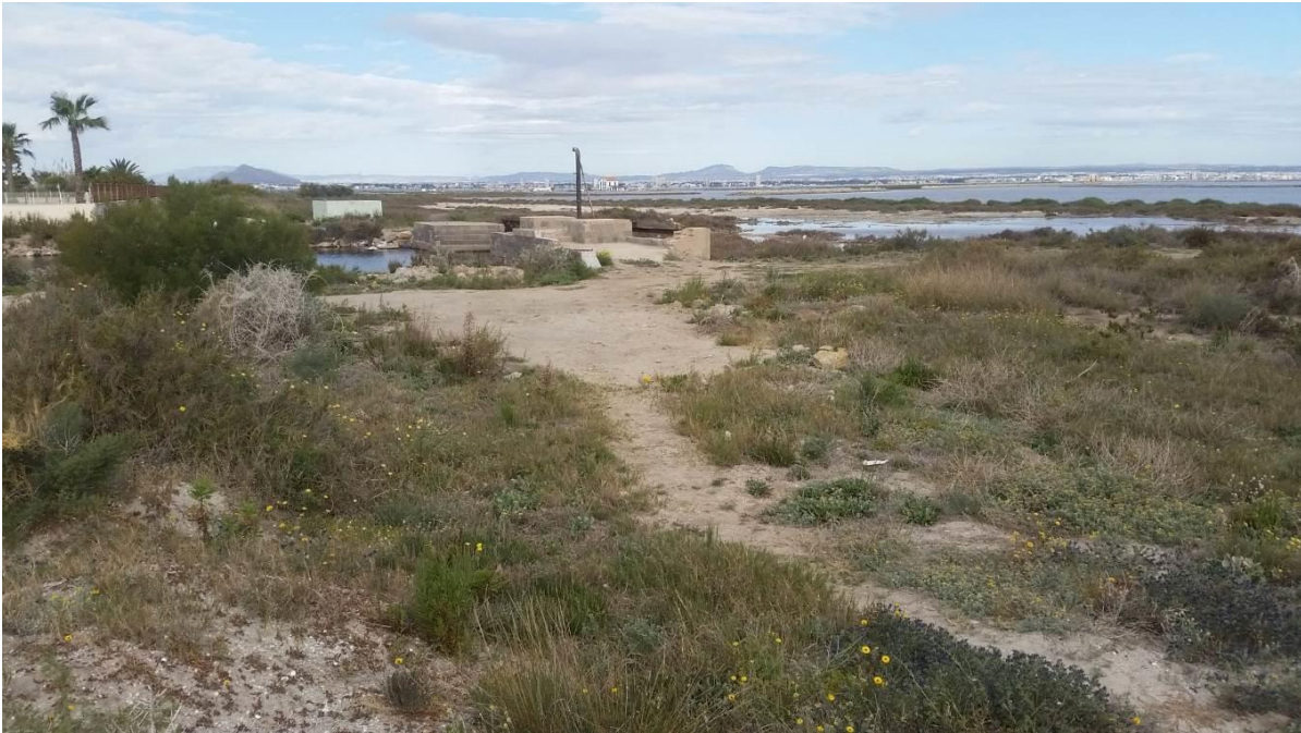
Fotografía del sendero a su paso por el saladar y llegando al canal de Veneziola.

Una vez retomado la senda éste atraviesa una gran superficie paralela al mar, alrededor de 24.000 m 2 , de arbustos y hierbas de saladar, arenal, carrizales, juncales y zonas degradada. Esta superficie se trata en parte de unos solares sin edificar, aunque la senda no se introduce en propiedad privada. La senda está poco pisoteada y por ello aparece restos de vegetación en él. En este espacio de saladar encontramos especies protegidas: Asparagus macrorrhizus y Senecio glaucus y Lycium intricatum y especies invasoras: Carpobrotus edulis , Acacia saligna .