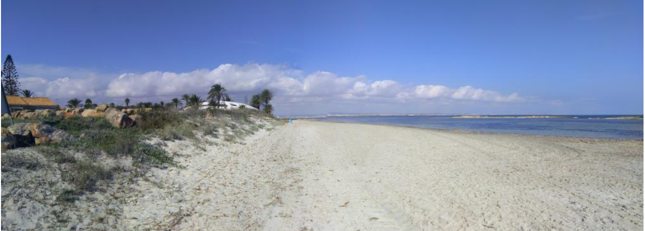
Fotografía de la zona del arenal dando al mar Mediterráneo, cercana a Collados Beach

El valor de este paisaje de dunas en formación es muy alto.