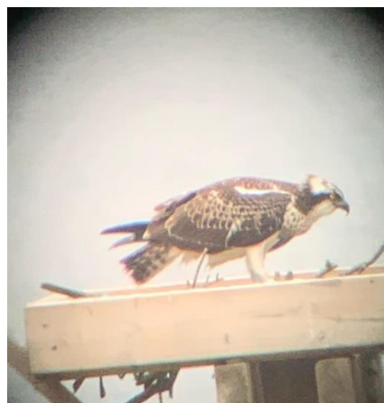
Foto 1. Detalle de la plataforma de nidificación del águila pescadora instalado en el año 2018 por voluntari@s de SEO/BirdLife en la marisma de Pombo y foto de un ejemplar posada en el mismo en agosto de 2019.