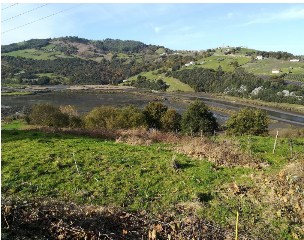
Foto 2. Zona de la Marisma de Rada donde se pretenden colocar las estructuras para favorecer la nidificación del águila pescadora.