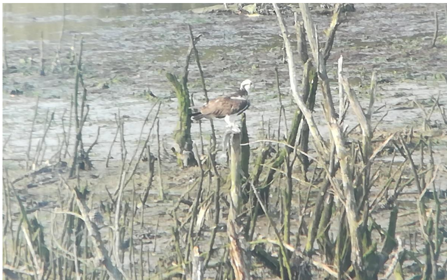
Foto 3. Imagen de una de las águilas pescadoras que utilizan la zona y lo endeble de los soportes sobre los que se asienta. .