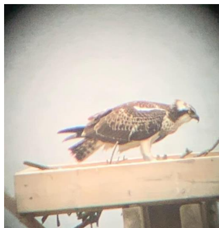
Foto 1. Detalle de una de las plataformas de nidificación del águila pescadora instalada en el año 2018 por voluntari@s de SEO/BirdLife en la marisma de Pombo y foto de un ejemplar posada en el mismo en agosto de 2019.