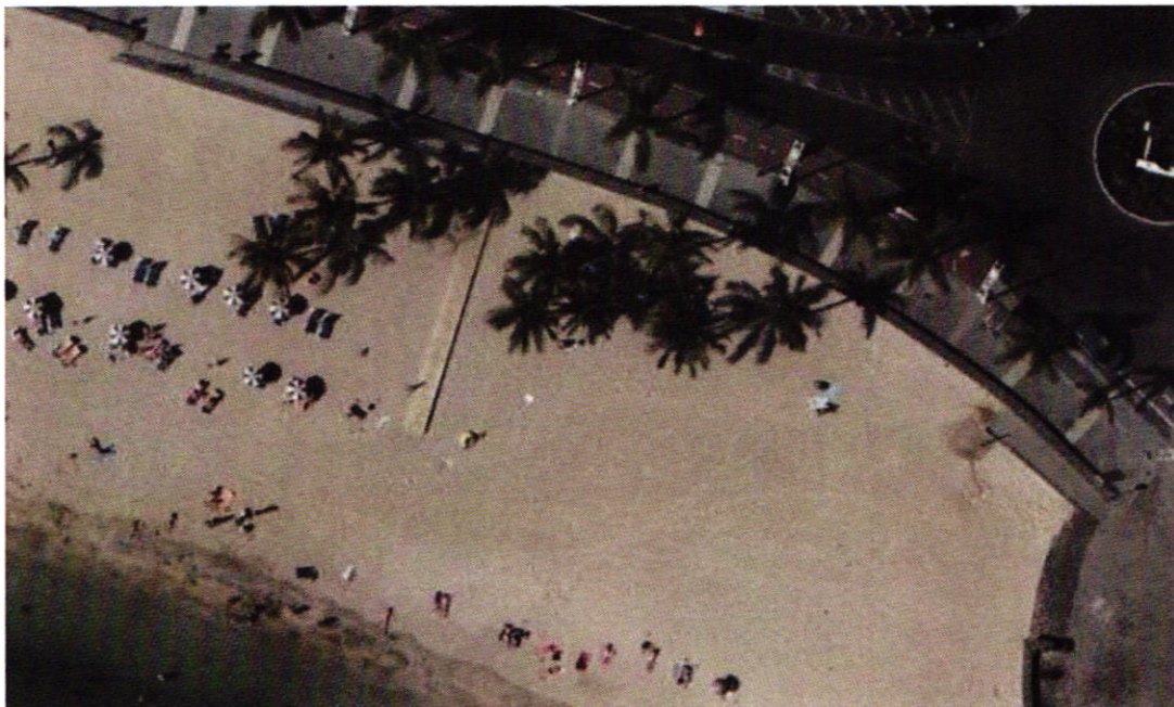
(Situación pasarela actual)

La estructura que se pretende instalar en la playa tiene las siguientes características: