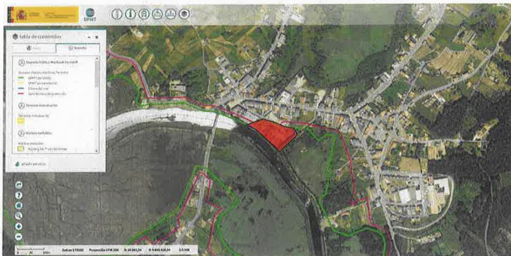
Ámbito de la solicitud de concesión

La superficie total objeto de la presente solicitud de concesión es de 10.470 m 2 .